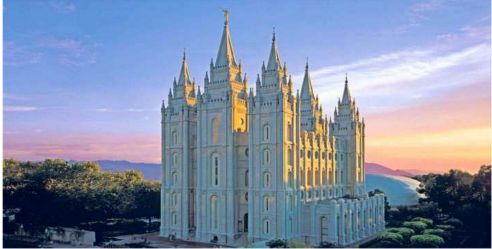
Mm. rikas mormonikirkko katsoo olevansa todiste Gamalielin neuvon jumalallisesta alkuperästä

Erään tilaston mukaan ns. "kristittyjä" on maailman väestöstä 33%. Paavin johtama roomalaiskatolinen kirkko neitsyen palvomisineen ym. epäraamatullisine rituaaleineen muodostaa tästä valtaosan. Kukaan ei tietenkään osaa sanoa, kuinka moni kristityn nimeä kantava on raamatullinen ns. "uudestisyntynyt" kristitty. Mutta varmuudella voidaan sanoa, että se joukko on vähäisempi. Muslimeja on 23% (kuvassa s. 13, vuonna 2007: 21%) ja he menestyvät. Kristittyjen prosentuaalinen määrä ei ole tilastojen mukaan kasvanut ainakaan 100 vuoteen mutta muslimien määrä on kasvanut kaiken aikaa ja kasvaa edelleen. Gamalielin neuvon mukaan se, joka vastustaisi islamia nousisi Jumalaa vastaan. Gamalielin neuvoa jakavat sanovat itseasiassa: älä ajattele, älä arvioi, älä käytä ymmärrystäsi, älä sano vastaan, hyväksy ja katsele sivusta, älä ota kantaa, älä muodosta mielipiteitä. Loppujen lopuksi eihän Gamaliel itsekin näin toiminut, kuten Apostolien teoissa kerrottu